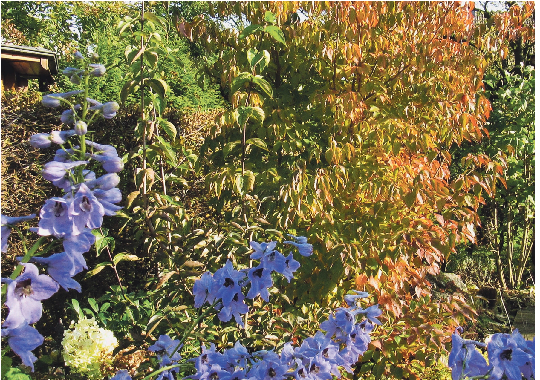
Im Herbst erlebt der Rittersporn (im Vordergrund) seinen zweiten Frühling.

Die spanische Opernsängerin Montserrat Caballé legt nach einem leichten Schlaganfall eine dreimonatige Pause ein. Die 79-jährige dürfte einem breiteren Publikum durch den Song «Barcelona» bekannt geworden sein, den sie 1992 zusammen mit dem Rockmusiker Freddie Mercury aufgenommen hatte. (sda)